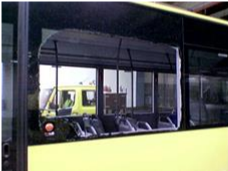
Blast og belægningssten har her smadret en busrude