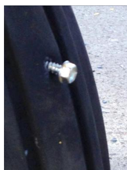
Bolt i flydæk