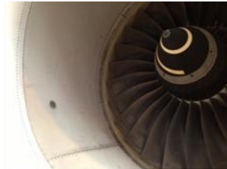
Reparation efter FOD skade i motor