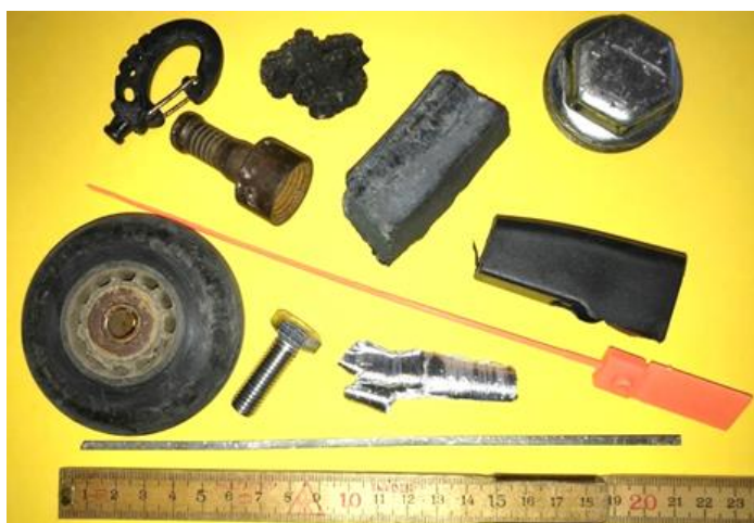
Eksempler på FOD over 3 cm

Alt FOD over 3 cm forventes observeret og SKAL fjernes.