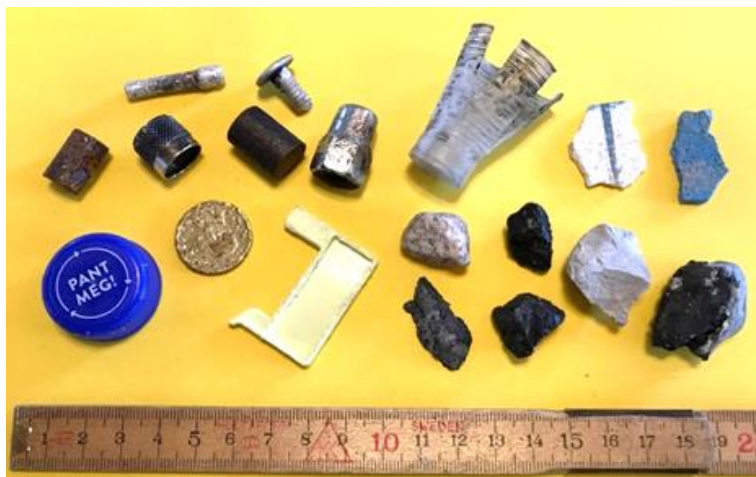
Eksempler på FOD mellem 1-3 cm

FOD mellem ca. 1-3 cm. Det forventes at der observeres minimum 75% og at alt hvad der observeres SKAL fjernes.