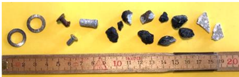
Eksempler på FOD op til 1 cm

Genstande op til 1 cm kan være svære og se, derfor kan de forekomme på vores belægninger. Hvis de observeres, SKAL de fjernes