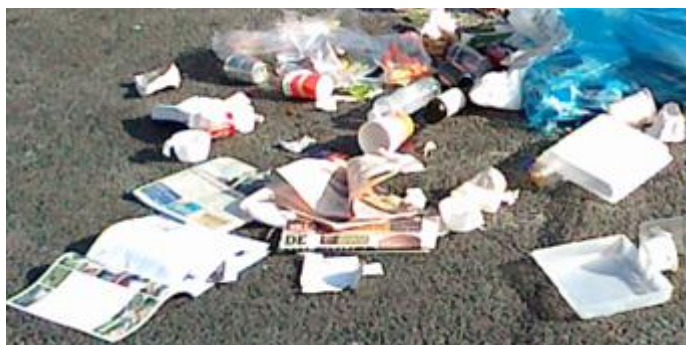
En pose affald der blev til FOD