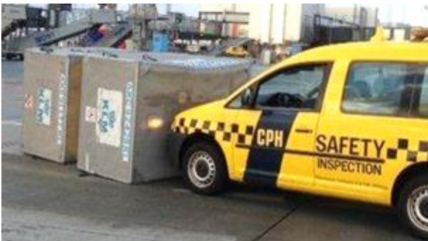
Flyvende bagagecontainere stoppet af bil