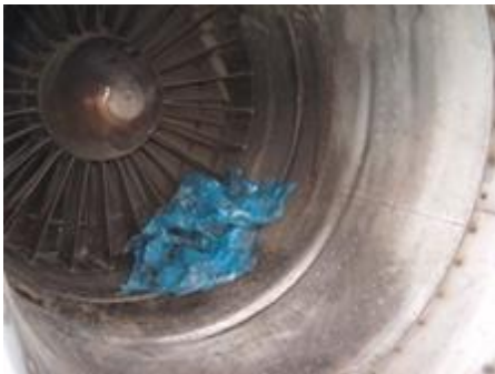
Plastpose i flymotor