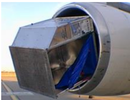
Løse containere er FOD