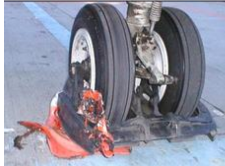
Kegle i næsehjul